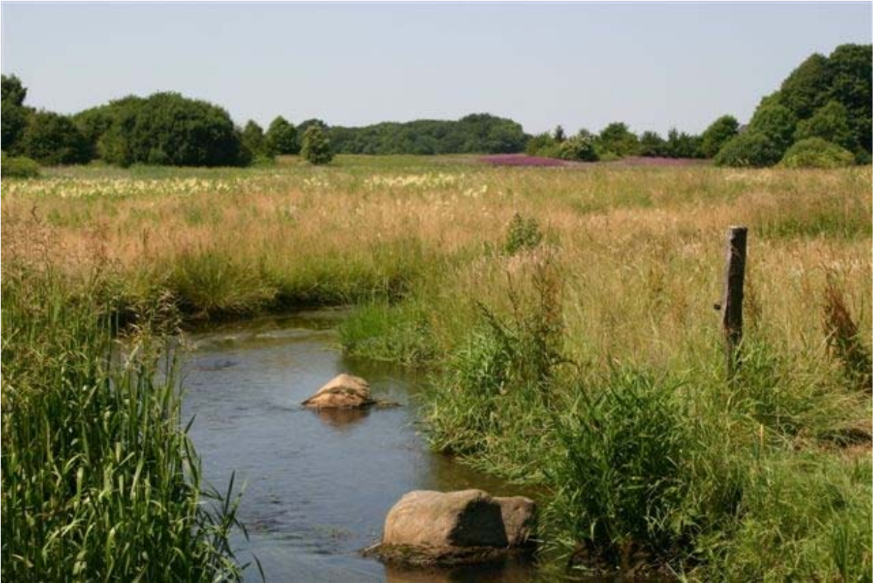
Set fra Hørsholm by fremtræder fredningsområdet visuelt som indgangen til et åbent land, der strækker sig vidt mod vest.