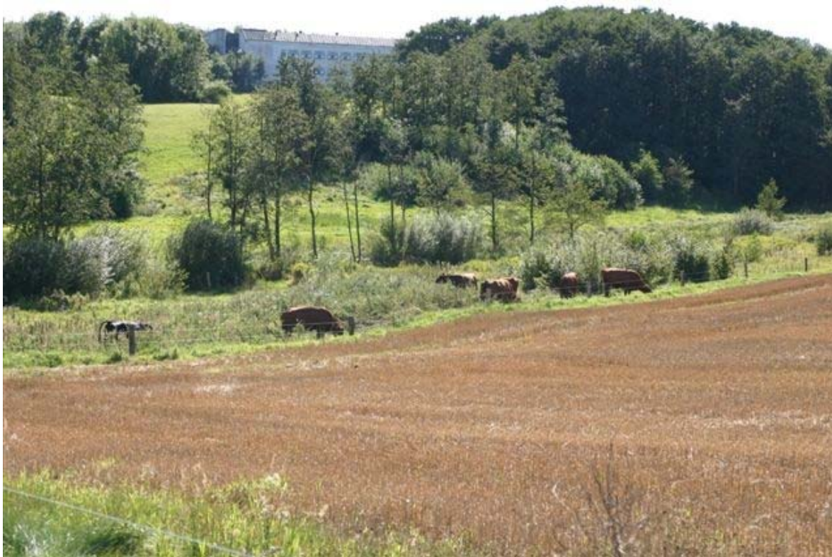
Terrænet falder dramatisk ned mod Usserød Å i områdets sydvestlige hjørne.

Stiforbindelsen mellem Sjælsø og Øresund er etableret og kaldes Usserød Å stien, Cykelrute 36 Nivå – Sjælsø. Det er et ønske at stien med tiden kan ændres på det sydlige forløb, så stien på en længere strækning kan følge åens forløb, bl.a. gennem etablering af tunnel under Helsingør motorvejen.