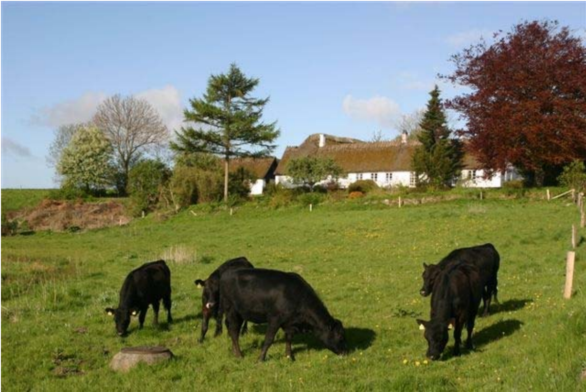
Mortenstrupgårds bygninger er blevet til over en lang periode. De ældste bygninger er fra 1750.